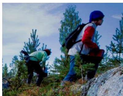
Thailändska bärplockare i Sverige

Den svenska landsbygden – jordbruk och skogsbruk – präglas alltmer av säsongarbetare från olika länder. En av de mest uppmärksammade grupperna är thailändska bärplockare, som plockar blåbär, lingon och hjortron under sommarmånaderna för en global exportmarknad. Bärplockarna kommer huvudsakligen från nordöstra Thailand, Isaan, som är den fattigaste regionen i landet. Det är ingen slump att detta är samma region som de thailändska kvinnorna som gift sig med svenska män kommer ifrån. Tvärtom finns en tydlig koppling: Under 1990-talet började kvinnorna bjuda in sina släktingar för att plocka bär som de såg en stor inkomspotential i. Från början kom bara ett fåtal släktingar, men med tiden växte detta till att involvera allt fler personer. Idag har processen förändrats. Thailändska rekryteringsföretag anställer bärplockare som bjudits in av svenska bärföretagare, som tillhandahåller kost, logi och transportmedel åt bärplockarna.